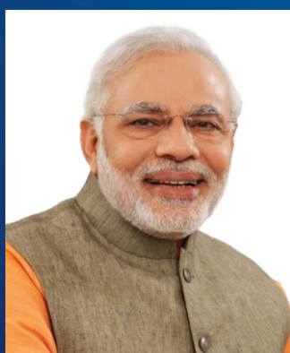
Shri Narendra Modi Prime Minister, India

Haryana Skill Development Mission Government of Haryana